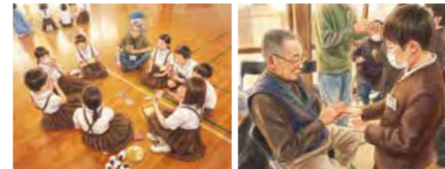
▲遊びや会話を通じて世代を超えた絆を深める