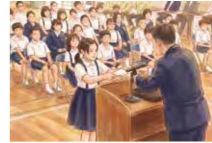
▲真新しい委嘱状を受け取る子どもたち

「思いやりの心を胸に、今日からスタート」。真新しい委嘱状を手に、子ども民生委員としての第一歩を踏み出します。期待と少しの緊張を胸に、地域のために自分たちにできることは何かを考えながら、活動の準備を始めます。