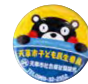
くまモンピンバッジ