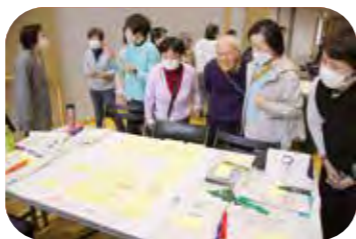
各グループの意見を見て回り共有