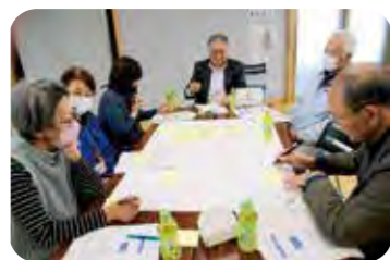
事例をもとに活発な意見交換

意見交換のなかでは、孤立している世帯の事例をもとに、『関係づくりのためのアイデア』を出し合ったり、『気持ちに応えるための作戦』を行ったりしました。