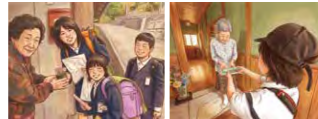
▲地域の民生委員と共に高齢者宅へ訪問

民生委員の方々や地域のお年寄りや、トランプなどの伝承遊びを通じて世代を超えたコミュニケーションを図ります。また、手作りのメッセージカードを直接手渡し、地域の方々へ笑顔と元気な挨拶を届けています。