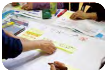
アイデアを付箋で出し合い整理