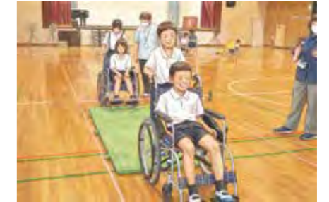
▲車いすの操作方法を実践で学ぶ

車いす体験などの福祉学習を通じて、相手の立場に立って考える力や、思いやりの心を育みます。実際に体験して生きた知識を得ることで、地域での見守り活動や日常生活における「支え合い」に必要な視点と優しさを養います。