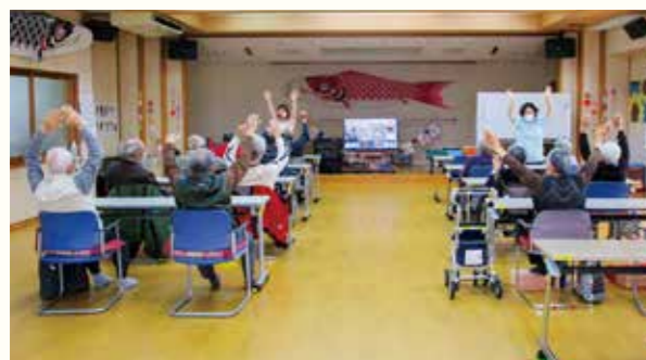
通所介護の風景(写真:デイサービスセンター河浦)

介護・看護の専門職員がいる事業所（デイサービス）へ昼間の時間帯に通い（送迎支援あり）、機能訓練や日常生活に必要な介護・支援を受けられるサービスです。通いによる支援には、リハビリテーション等の心身機能向上を目的とした『通所リハビリテーション』と閉じこもり予防や介護負担の軽減を目的とした『通所介護』のサービスがあります。