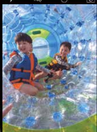
※令和5年度 あまくさ福祉まつり作品展特選写真作品