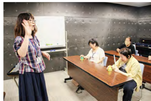
稲田氏による音を使った頭の体操