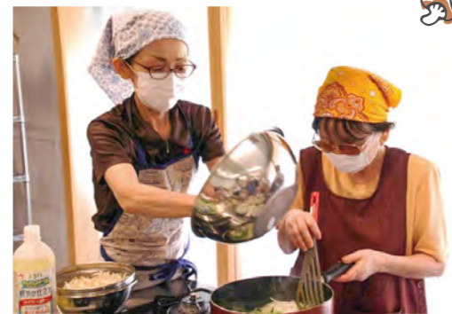
豚の生姜焼きを料理中

視覚障がい者の皆さんからは、「おいしい料理に音楽と楽しく過ごせました」と感想を述べられていました。