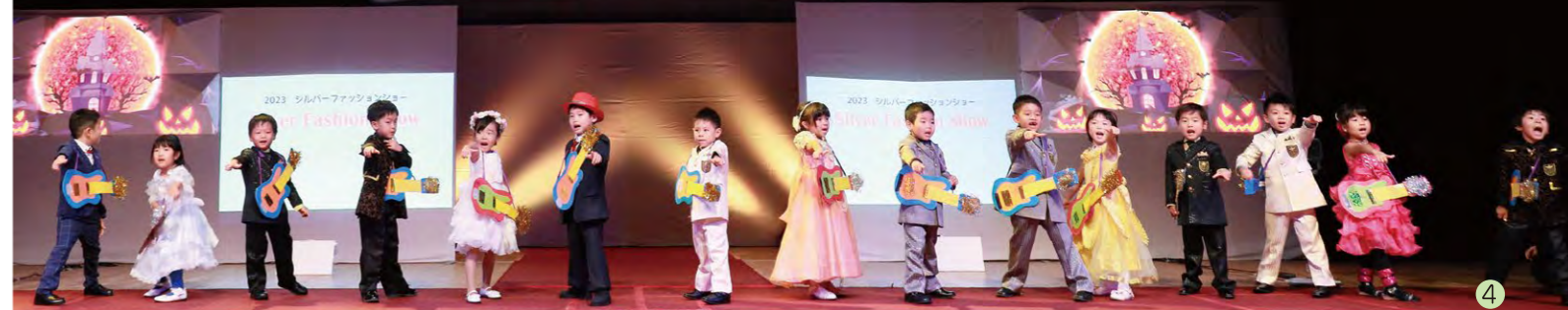
箱ノ水保育園 園児のみなさん