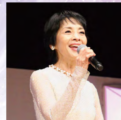
ゲストコメンター 由美 かおる 様