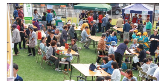
あまくさ福祉祭り