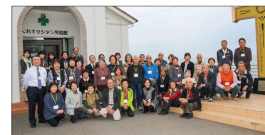
天草いきいき夢大学