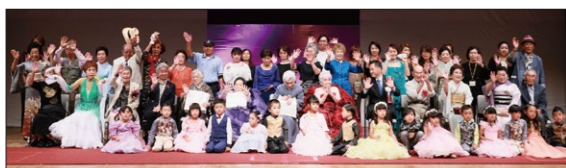
あまくさシルバーファッションショー