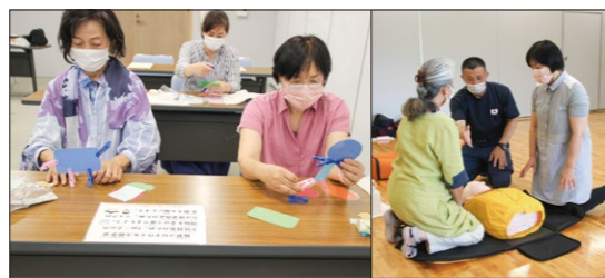
ファミリーサポートセンター研修会