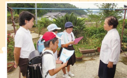
メッセージカードの配布