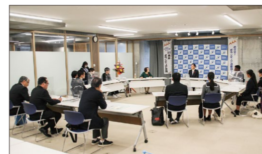
中高生と天草市長とのボランティアトーク