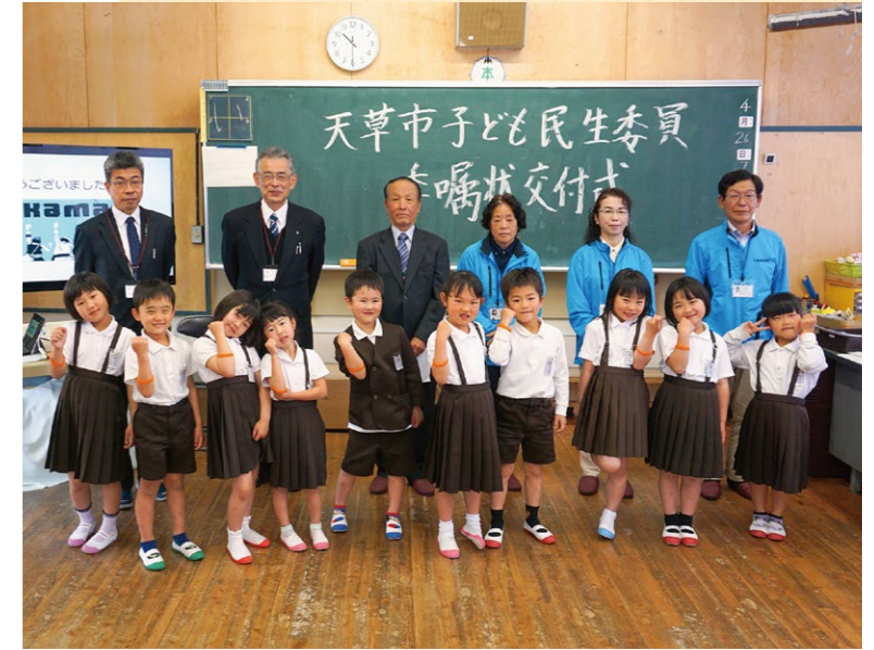
天草市立本町小学校 1年生の皆さん!!

また、地域の繋がりの大切さを学び、地域の方々と関わることで、自ら進んで行動できる児童を育て、もっと地域福祉の増進と共生社会の構築を図っていきます。