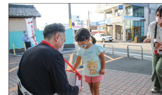
赤い羽根共同募金 街頭募金