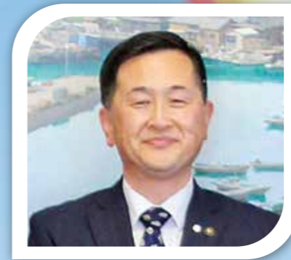
馬場 昭治 天草市長