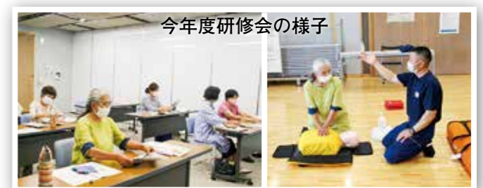
今年度研修会の様子

令和5年度も開催を予定していますので、ご興味のある方は、是非受講していただき、 協力会員の登録 をお願いします!