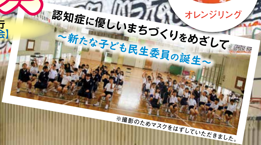
※撮影のためマスクをはずしていただきました。