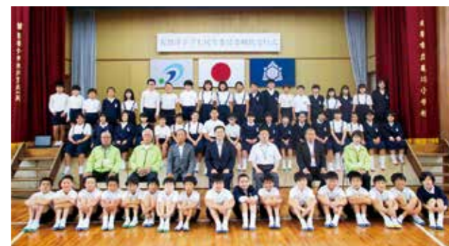
天草市立亀川小学校 5年生の皆さん

また、地域の繋がりの大切さを学び、地域の方々と関わることで、自ら進んで行動できる児童をはぐくみ、地域福祉の増進と共生社会の構築を図っていきます。