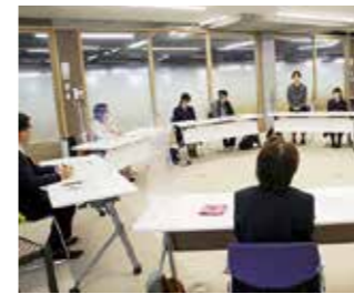
中高生と馬場昭治天草市長とのボランティアトーク