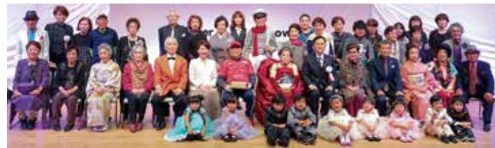
あまくさシルバーファッションショー