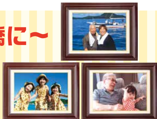
思わず笑顔になってしまう、これまでの優秀特選作品