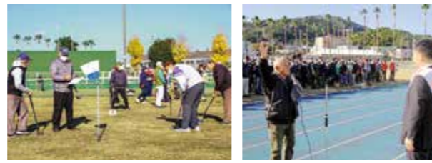
健康づくり日本一推進グラウンド・ゴルフ大会