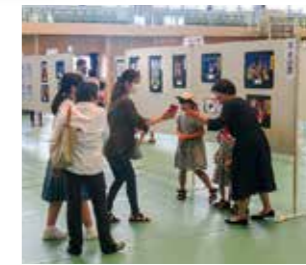
あまくさ福祉まつり