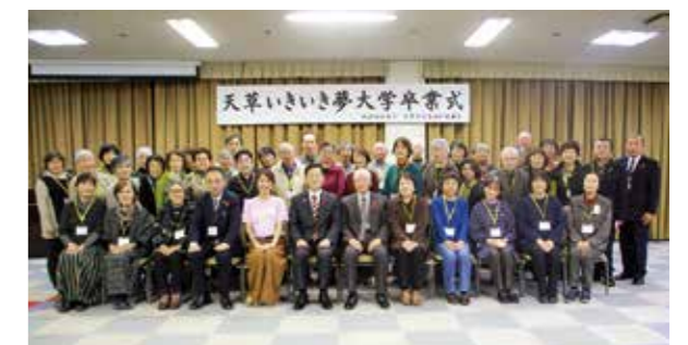
天草いきいき夢大学入学式・卒業式