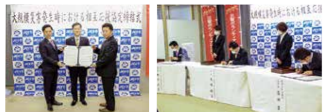
災害時相互応援協定 締結式