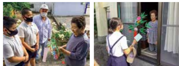
ふれあい七夕事業（子ども民生委員の活動）