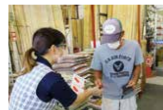
赤い羽根共同募金メッセージ伝達式・街頭募金