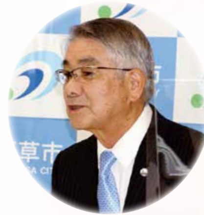
天草市長 中村 五木