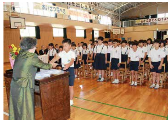
▲5月10日(金) 天草市立五和小学校4年生

天草市社会福祉協議会では平成27年度から、天草市の各小学校の児童を子ども民生委員として委嘱しています。