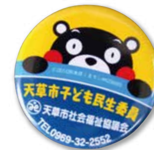
▲子ども民生委員ピンバッジ (実物大・本会オリジナル)