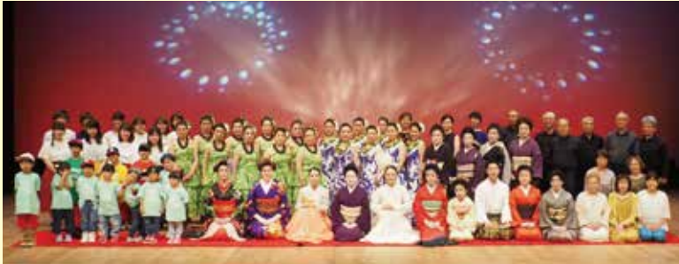
▲ご出演された皆様