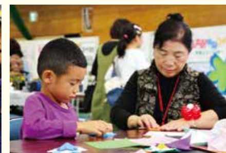
※写真は平成28年度の様子です。