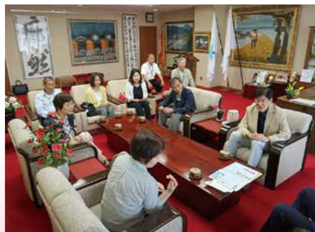
▲意見交換会の様子