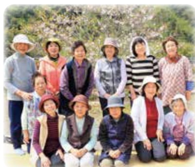
「わかば」みんなで記念に1枚

「わかば」では、四季折々の行事も開催されています。今回の集まりは「お花見会」でしたが、参加者みなで旬の食材を使ったお花見弁当を作られ、いつもの体操を終えたら、桜の花咲く近所の公園へ出かけられました。