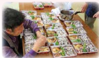
参加者みなでお弁当作り!

平成29年5月に立ち上がった通いの場「わかば」は、「活動の時間は笑って過ごす!」をモットーに、67歳から93歳までの幅広い年齢の参加者が集い、認知症予防パズルや、いきいき100歳体操に取り組まれています。