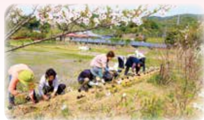
花植えのボランティア