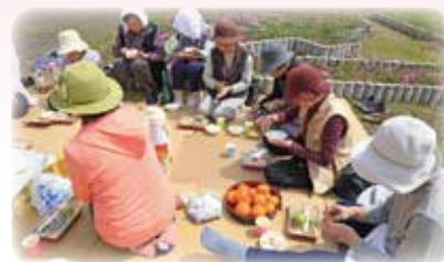
お花見弁当いただきます