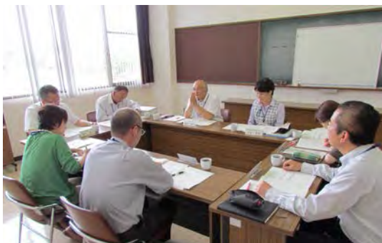
第1回 支援調整会議のようす