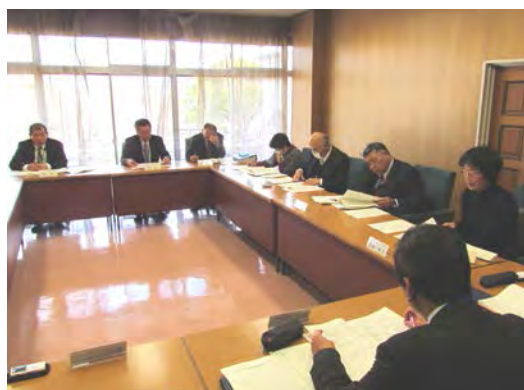
第3回 支援調整会議のようす