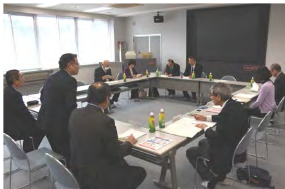
第4回 支援調整会議のようす