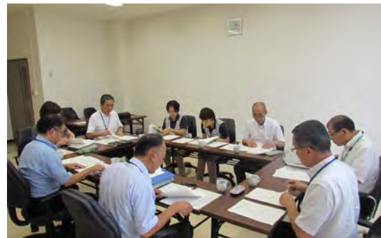
第2回 支援調整会議のようす